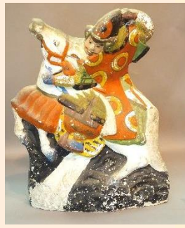
三原人形 明治 20 年頃

「端午」とは、もとは端(はじめ)の日という意味でしたが、「午」と「5」の音が同じで5月5日になったと言われてい ます。奈良時代、5月は季節の変わり目で病気になるやすく、 薬草の「菖蒲」を軒につるして無病息災を祈る行事がありま した。武家社会になると、その「菖蒲」が「尚武」という言 葉にかけて、いつしか勇ましい男の子の誕 生と成長を祝う行事にと変わっていきまし た。久井では、明治から昭和の初めにつ けて、端午の節句のお祝いに、当時強くて 立派だと言われていた人をモデルにした 土人形を男の子に贈る風習がありました。 当館では常時展示しておりますので、 どうぞご見学にいらしてください。