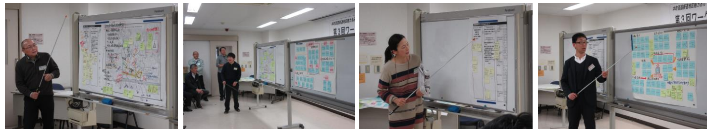
景観ルールづくり(班) 施設整備(班) 地域資源活用(班) 商店街・コミュニティ活性化(班)