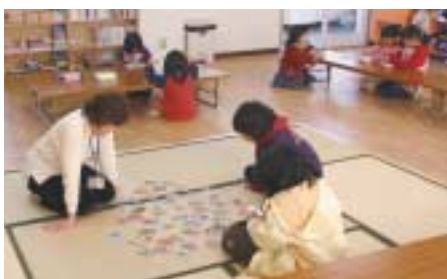
学校が終わってから、小学1～3年生が集う放課後児童クラブ