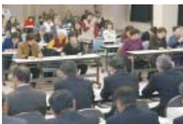
女性を対象とした懇談会では、男女共同参画についてなどの意見が出されました

回答 市の活力を取り戻していくため、苦戦しているのは事実です。しかし、工業については、情報先端産業など活発な業種もあります。また、商業についても、中心市街地が、郊外の大規模店の影響を受ける中、集客イベントの開催などで頑張っています。