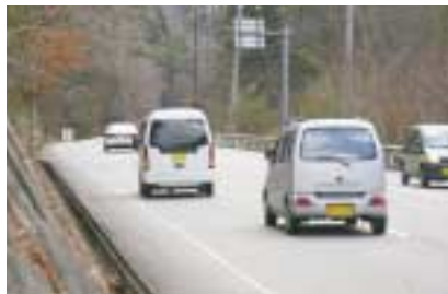
バイパスの建設が待たれる県道三原東城線

回答 市の活力を取り戻していくため、苦戦しているのは事実です。しかし、工業については、情報先端産業など活発な業種もあります。また、商業についても、中心市街地が、郊外の大規模店の影響を受ける中、集客イベントの開催などで頑張っています。