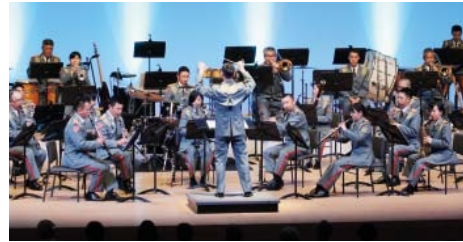
▲陸上自衛隊第13音楽隊

※入場には座席指定入場券が必要です。入場券(1人2枚まで)は4月25日(木)9時からポポロで配布します。※3歳児から入場できます。