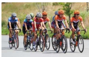
▲昨年5月に行われた事前合宿の様子