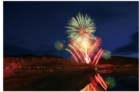
▲花火と夜桜の共演が楽しめます