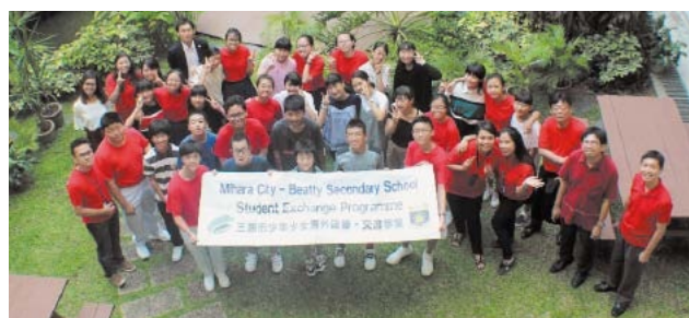
▲昨年の研修の様子

郵送で申込書(提出先・市ホームページに用意)を少年少女海外研修交流実行委員会(生涯学習課内〒723-0015円一町二丁目3番1号☎0848・64・2137)へ