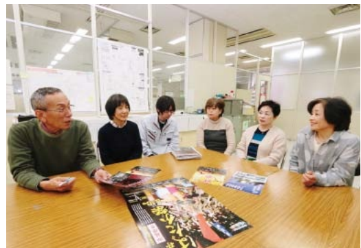
▲連携して活動する地域おこし協力隊員と地域支援員(写真は久井地域の様子)

地域の活性化のため、住民組織などと連携して活動する地域おこし協力隊員を6人から9人へ増員