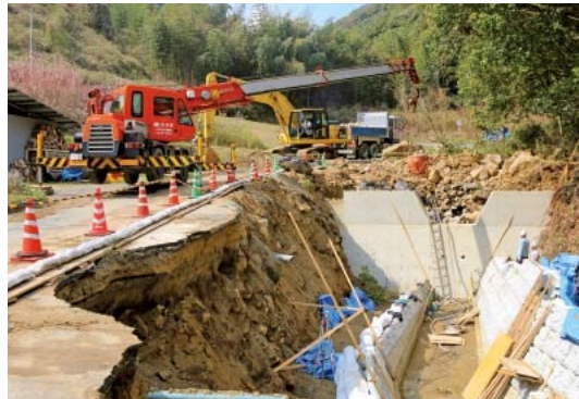
▲被災した道路や河川などの復旧工事を実施(写真は善入寺川の支川)