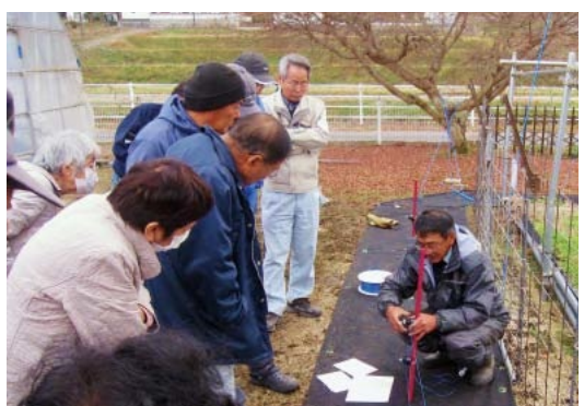
▲イノシシなどの侵入を防ぐ電気柵の設置方法を説明する宮農指導嘱託員