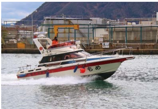
▲平成14年に就役した救急艇「かもめ」を更新