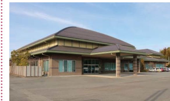
▲支所機能が移る久井保健福祉センター