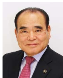
三原市長 天満祥典

平成31年度の一般会計当初予算額は501億9,700万円です。昨年度と比べて25億1,900万円(5.3%)増加し、過去最大規模となりました。豪雨災害からの復旧・復興を最優先に進めると同時に、将来の「元気な三原」実現に向け、「働く場づくり」「子ども・子育て充実」「住み良さ向上」などに重点的に取り組んでいきます。