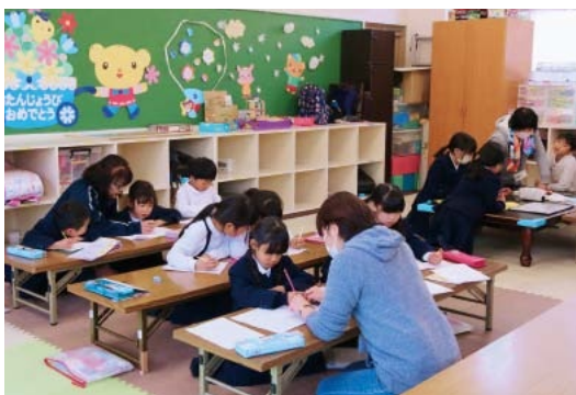
▲小学6年生までの児童を受け入れる放課後児童クラブを拡充