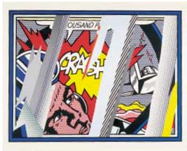
ロイ・リキテンスタイン「クラッシュに反射(反射シリーズより)」1990年

アメリカ版画が、世界の現代美術史に重 要な役割を果たしてきたことは、意外に知 られていません。アメリカ版画の特徴は、 版画のイメージをくつがえすような大きな サイズや複雑な技法にあります。本展では、 大日本印刷が所蔵する1,000点以上のコ レクションから代表作60点を展示し、アメ リカ現代版画芸術の魅力を紹介します。