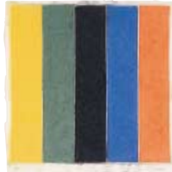
エルズワース・ケリー「着色した紙によるイメージ XIII」1976年