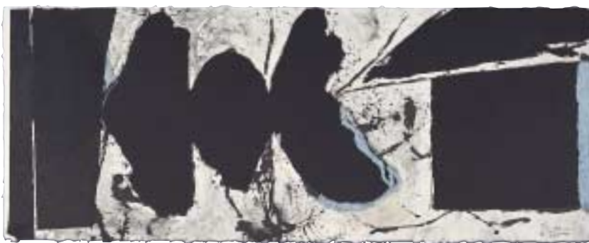
ロバート・マザウェル「黒、黒の哀歌(エル・ネグロより)」1983年