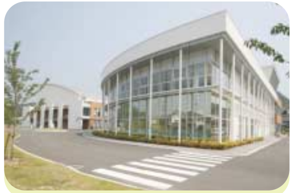
現在は、本郷生涯学習センターとなっている