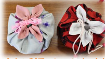
古布を利用したほおづき巾着

榎梨公民館では平成31年度主催講座の受講生を募集しています。 期間 平成31年5月～平成31年2月(年10回) 申込み 往復はがきに(1講座1枚)記入し榎梨公民館までお送りください。 詳しくは、広報みはら3月号をごらんください。 または、榎梨公民館 相談員へお尋ねくださいませ。♡