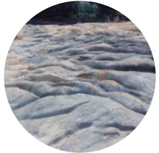
吉田山甌穴群 数千万年前にできた歴史的産物