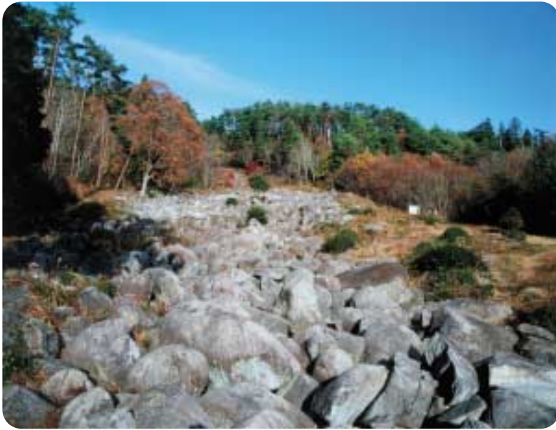
久井の岩海(国の天然記念物) 風の音と野鳥のさえずり。そして、地下の流水音。人々にやすらぎを与える自然のオアシス