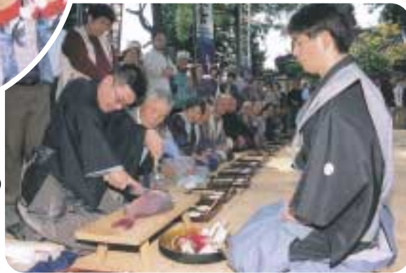
場の魚(10月) 魚に手を触れず、金箸と包丁で調理