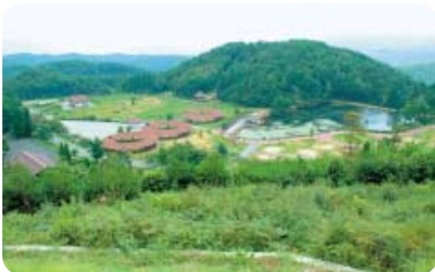
宇根山家族旅行村 高原の空気でリフレッシュ! ここは太陽と星の王国です