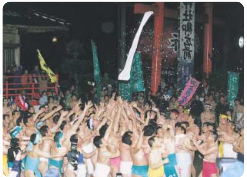
はだか祭(2月) 裸の男たちが、御福木の奪い合いを繰り広げます。 湯気が立ち込めるほど激しい熱気!

久井は、備南の高台に位置し、夏は涼しく過ごしやすいことから、「さわやかな高原のまち」として知られています。観光名所や楽しいお祭りがたくさんあり、また、三原久井ICから近いこともあり、多くの人を訪れています。