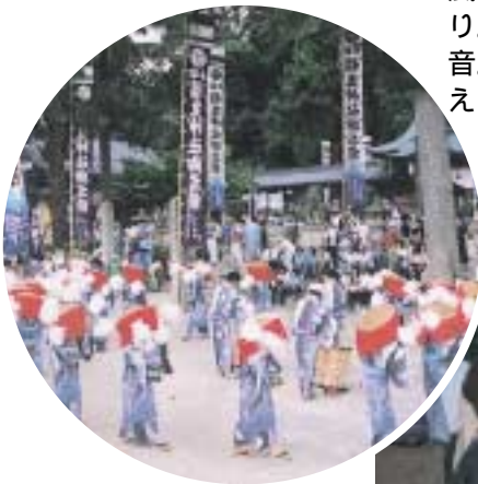
祇園祭(7月) 久井稻生神社に奉納