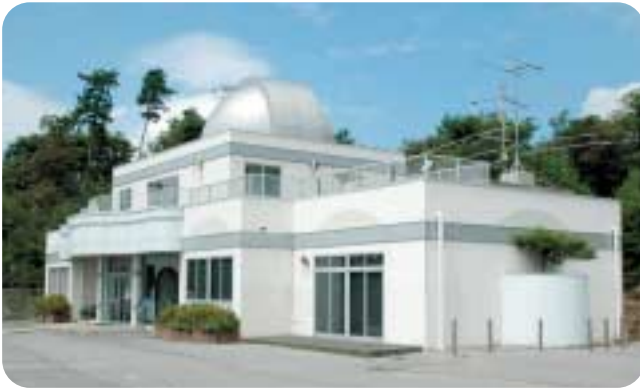
うねやま 宇根山天文台 備南最高峰の宇根山で、スターウォッチング!