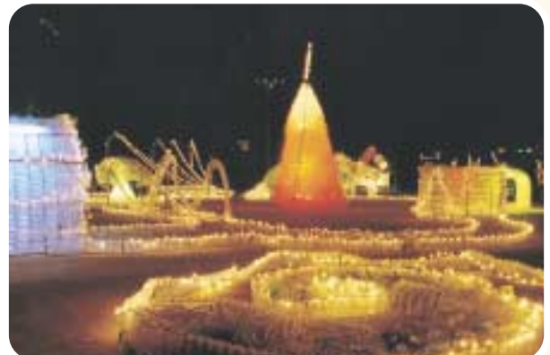
光のイルミネーション(11月下旬~1月上旬) ペットボトル3万個と豆電球2万個を使った、光のオブジェ