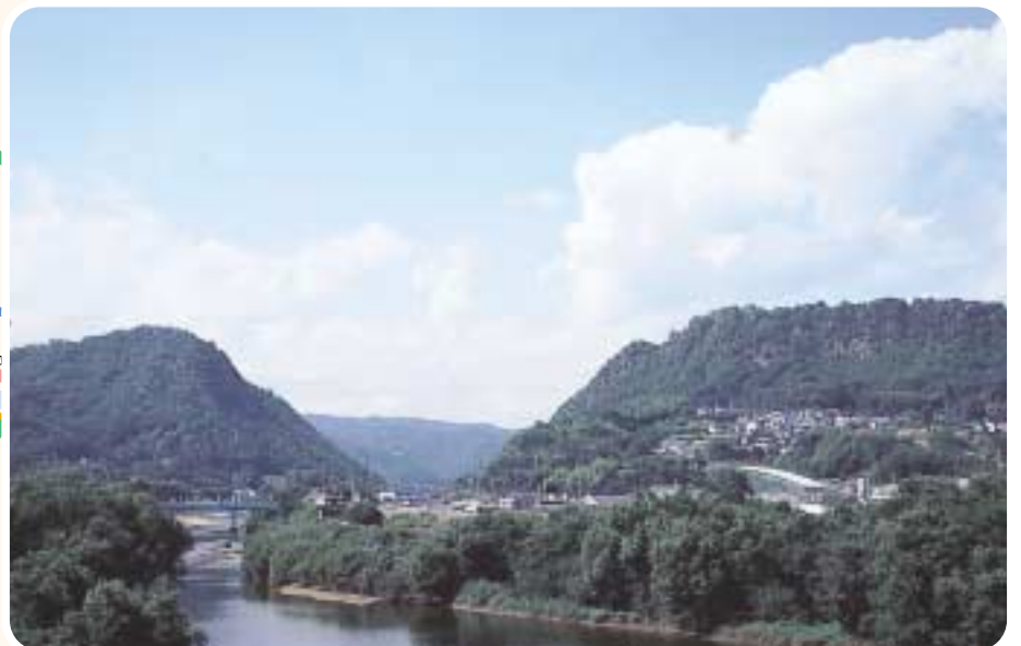
にいたかやま たかやま 新高山・高山城跡 毛利元就の三男、小早川隆景が築き、約45年間本拠として使いました

また、広島空港や山陽自動車道のICなどがあり、県内中央の高速交通拠点となっています。