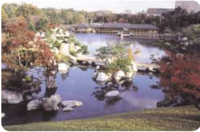
三景園 中国山地の渓谷美、山里の風景、瀬戸内海の景観をモチーフにつくられた日本庭園