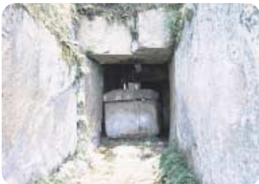
御年代古墳(国の史跡) 古墳時代の末期に、建てられたものといわれます