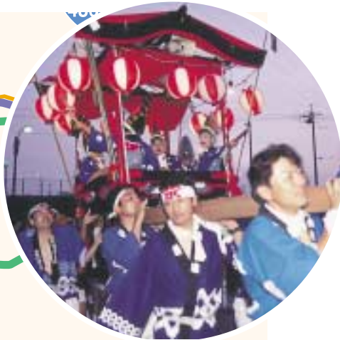
沼田本郷夏まつり(7月) みこし太鼓や花火が祭りを盛り上げます

本郷は、古くから沼田川流域の中心として、中世には小早川氏の城下町として、近世には山陽道の宿駅として栄えた町で、多数の古墳や遺跡、景勝地などに恵まれています。