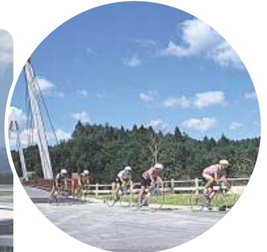
県立中央森林公園 家族で楽しめる施設が盛りだくさん！