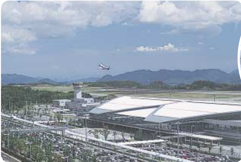
広島空港 中・四国地域の拠点空港。国内線はもちろん、海外への定期便も