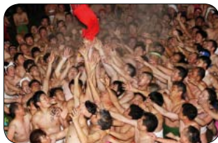
▲久井稻生神社のはだか祭