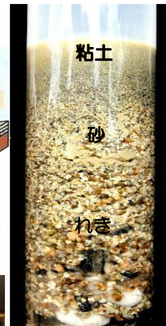
筒による堆積物の実験