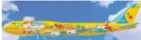
©Nintendo・Creatures・GAME FREAK・TV Tokyo・ShoPro・JR Kikaku ©Pokémon ©2004ピカチュウプロジェクト