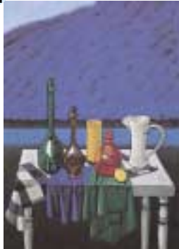
池田道夫《河畔静物》1988