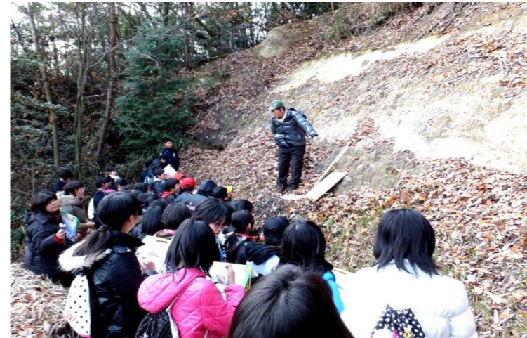
すべり地層 (トチ谷)