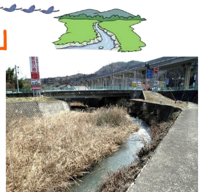
三原・久井IC付近 御調川の流れが急に変わっている