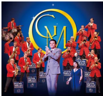
▲ザ・グレン・ミラー オーケストラ