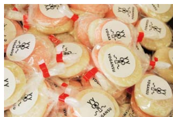
▲各日先着で紅白餅をプレゼント