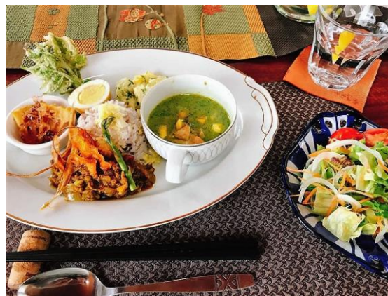
島時間「鷺邸」ページ追加