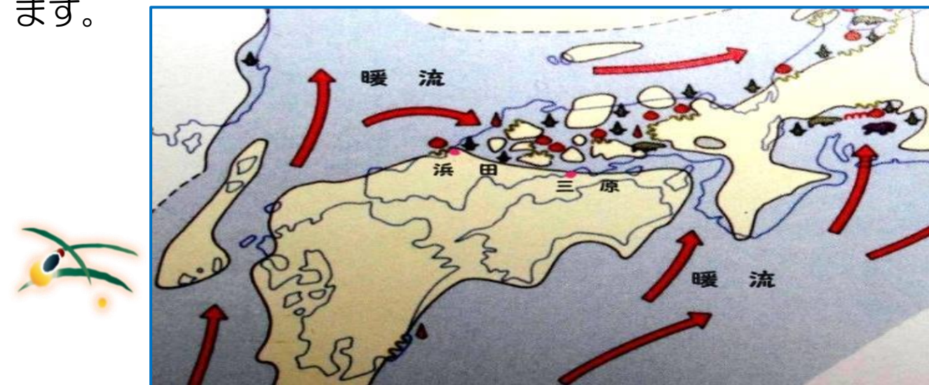
新生代(1600万~1500万年前)の古瀬戸内海