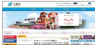
▲三原市ホームページ