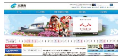
▲三原市ホームページ

この調査は、市の広報活動について市民の皆さんの意向を調査し、今後のより良い広報活動につなげるために実施するものです。たくさんのご回答をお待ちしています。