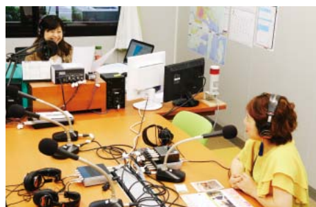
▲リージョンプラザにあるスタジオ。放送のようすをガラス越しに見ることができます

先月開局したFMみはらは「フォー・ライフ・レディオ」を合言葉に、市民の暮らしに密着した情報を放送しています。そんな地域密着のラジオ局FMみはらの番組の一部を紹介します。