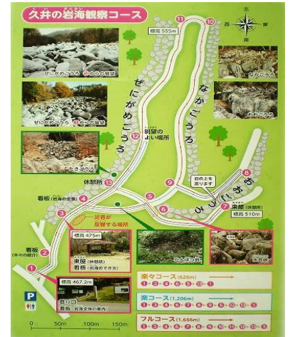
「久井の岩海」は最終回です。次回からは別のテーマを掲載します。