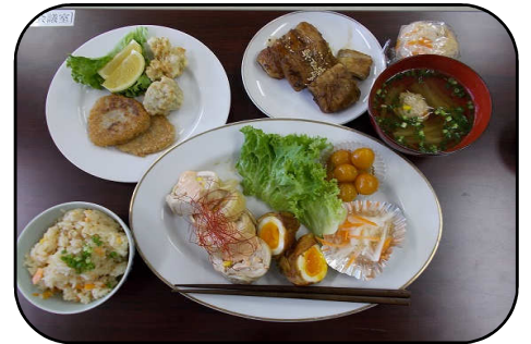
昨年度料理教室の調理例