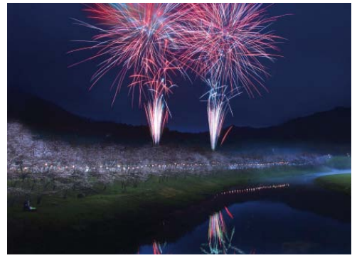
▲満開の夜桜と花火の共演が楽しめます