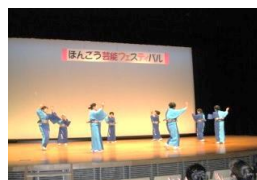
沼田本郷の名水音頭踊ろう会