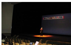
吟道學眞会 花みずき