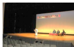
民謡秀諒会 本郷支部