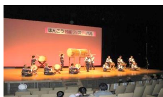
安芸本郷太鼓同好会