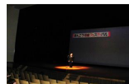
哲滄会 本郷支部第2分会