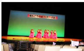
レイフラワーラウリア本郷