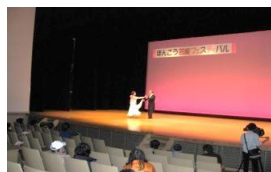
本郷ソーシャルダンスクラブ