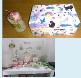
(写真は今年の発表会です。)

2月7日に、大和地域の生涯学習相談員と図書館員が、大和文化センターで通報・消火・避難訓練・AEDの操作方法・心肺蘇生法等を学びました。緊急時に迅速に対応できるよう、日頃から常にあわてることのないよう、講習で学んだことを生かしたいと思います。