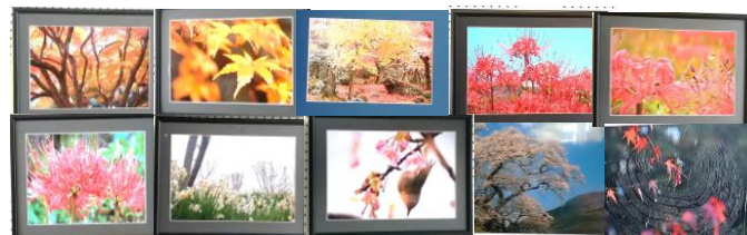
(作品は大和文化センターに2月2日から2月16日まで展示されました。)

写真に興味のある方はどなたでもどうぞ。 「毎月第1・3金曜日 13:30～15:00」 「お問い合わせ Tel 0847-34-0414 加川」