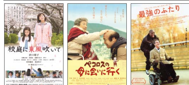
校庭に東風吹いて ペコロスの母に会いに行く 最強のふたり

入場料 1作品:1,300(1,000)円、3歳～高校生600円、60歳以上1,100円、どちらかが50歳以上の夫婦2人で2,200円