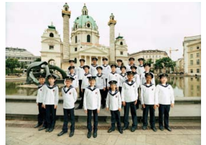
▲ウィーン少年合唱団