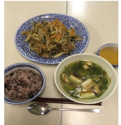
冬の薬膳料理メニュー