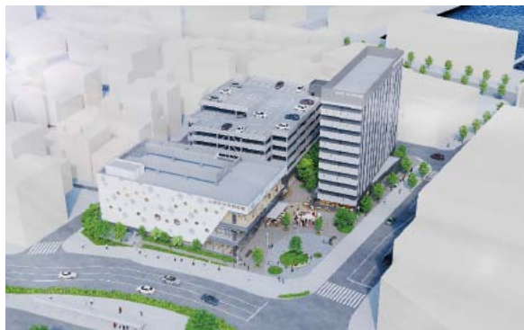
※図は提案資料として提出されたもので、実際の建築物とは異なる場合があります。

駅前東館跡地に公共施設と民間施設の複合施設を整備する事業者を、公募型プロポーザル方式で募集したところ、2つのグループから応募がありました。提案内容について学識経験者などで構成する審査会で審査を行い、その結果を踏まえて、次のとおり優先交渉権者を決定しました。