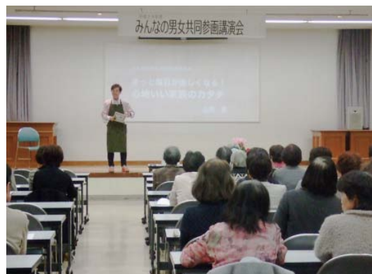
▲男女共同参画や家族をテーマに講演会を開きました

り組んでいます。 毎年11月には、市内の9つの女性団体で構成する「みはらウイメンズネットワーク」と協力し、ピンクリボンキャンペーンを実施。無料の乳がん検診や自己検診の方法の説明などを行なっています。