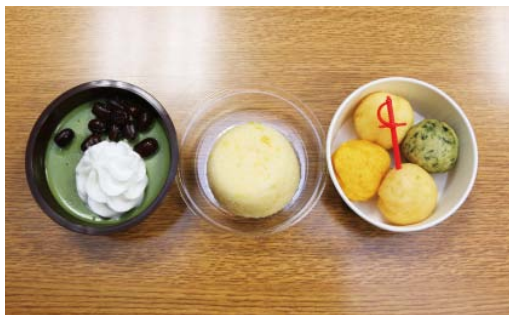
▲商品化が決まったおやつ(左から)なめらか米粉プリン、米粉deレモンみるくまんじゅう、もちり！米粉ドーナツ☆

市と商工会議所などでつくる瀬戸内三原築城450年事業推進協議会は、三原食と市が生産から販売までを支援している米粉の認知度を高めるために同校と連携し「三原新グルメ開発甲子