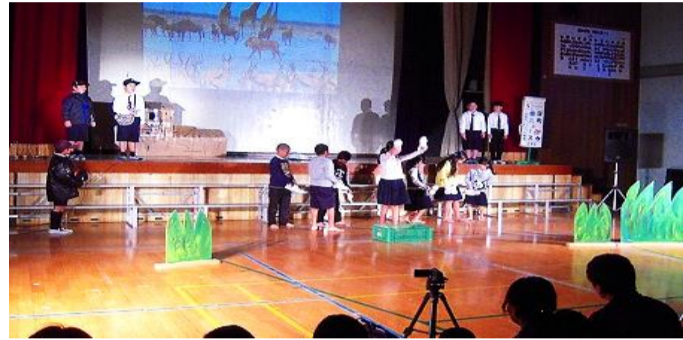
参加者を感心させた発表内容 (深小)