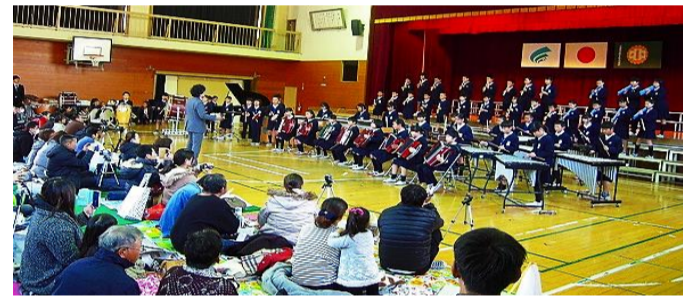
感動のハーモニーを奏でてくださいました (中之町小)