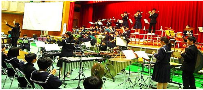
生徒たちの発表レベルが高いのが印象的 (二中)