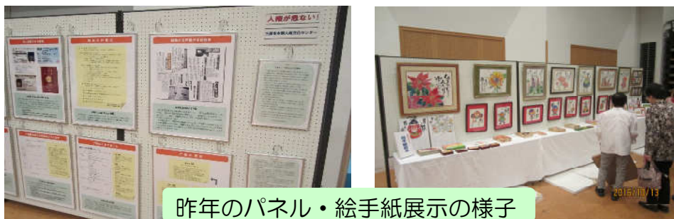
昨年のパネル・絵手紙展示の様子

○市民の人権について関心を高め、人権の尊重について正しい理解を深めるために、「大久野島の毒ガスの歴史」パネルを展示します。