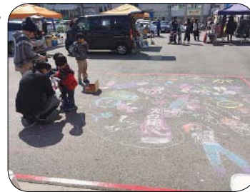
▲チョークでのお絵かき体験