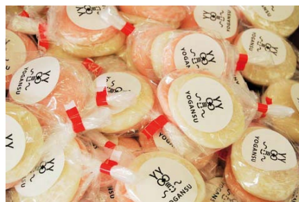
▲各日先着で紅白餅をプレゼント