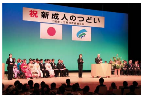
▲前回の成人式の様子