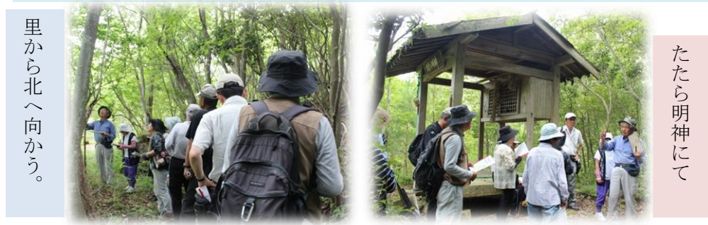
里から北へ向かう。

7月11日（火）植物観察と史跡ウォーキング 元メダカの里周辺を散策しました。所有されている方のご好意により下刈りされている里山は、歩きやすく様々な植物と出会い、たたら明神の祠にも立ち寄りしました。その昔、たたらへの痕跡として鈇滓なるものを見つけることができました。実際に製鉄がされていたことが物証として何百年も残されていたことに驚きと不思議な感覚をおぼえました。