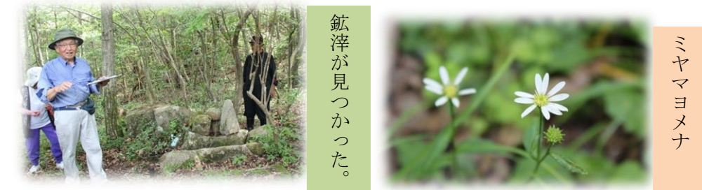
鈇滓が見つかった。