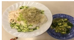
とろろ昆布&梅おろし風味そうめん