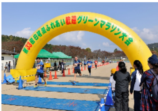
[白竜湖ふれあいグリーンマラソン]