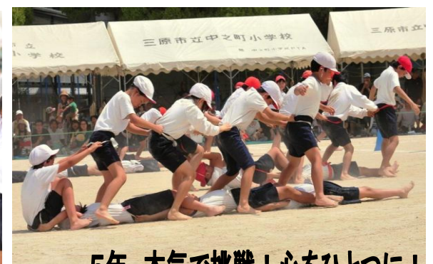
5年 本気で挑戦!心をひとつに!