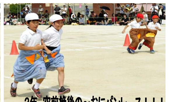
3年 空前絶後の～おにパンレース!!!