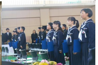
【三原市立須波小学校】