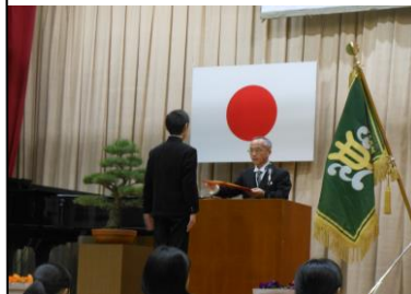
【三原市立第四中学校】

3月12日(日)は三原市立第四中学校、3月19日(日)は三原市立須波小学校で、卒業証書授与式が行われました。児童・生徒は「生涯学ぶ姿勢を忘れず、常に感謝の心を持ち続けてください。」「しっかりと地面に根を張って強くたくましく成長してください。」などのお祝いの言葉を胸に思い出深い学び舎を巣立って行きました。