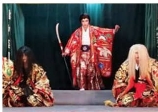
▲曙神楽団(北広島町)