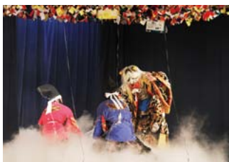
▲原田神楽団(安芸高田市)