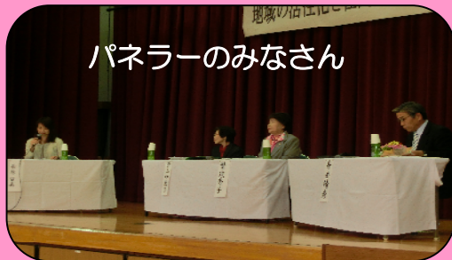
パネラーのみなさん

11月12日(火)、北方コミセンにて女性会・地区社協・希望会の交流会が開催され70名の参加がありました。当日は鼎談(ていだん)があり、地域のあり方、伝統行事を続けることの大切さなどが話し合われました。最後に女性会による手作りのドライカレーで会食し交流を深めました。