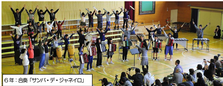
6年: 合奏「サンバ・デ・ジャネイロ」

各学年の発表時の盛大な拍手や、発表会終了後多くの皆様からの温かいお言葉により、子どもたち、職員は達成感を覚え、自信を持つことができました。