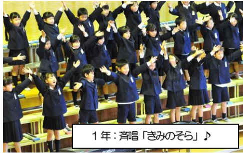
1年: 斉唱「きみのそら」♪