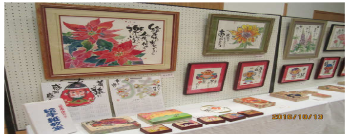
今年度のパネル・絵手紙展示の様子

○第39回ほんごう文化祭が、10月15日(土)・16日(日)に、三原市本郷生涯学習センターで開催されました。当センターは、作品展示の部で「人権啓発パネル」と「絵手紙」を展示しました。 ○市民の人権について感心を深め、人権の尊重について正しい理解を深めるために、「許すな! 戸籍の不正取得」・「人権が危ない」を展示しました。