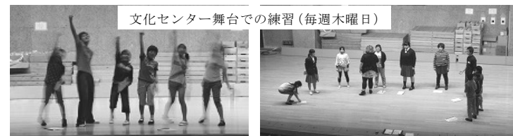
文化センター舞台での練習(毎週木曜日)

今年のミュージカルは、戦国時代を元気に駆け抜けた「海賊の子ども達」が、コンピューターを内蔵した青年たちと交流をし、不思議な体験をします。遠い戦国時代の中の子供達が無言で、子ども達の友情やロマンにご期待ください。(注)劇は創作ミュージカルです。歴史とは異なりますのでご了解ください。