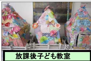
放課後子ども教室