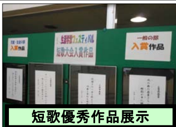
短歌優秀作品展示