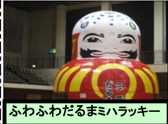
ふわふわだるまミハラクキー