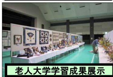
老人大学学習成果展示