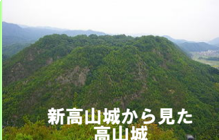
新高山城から見た高山城

沼田川沿いに開けた本郷町内には、古墳・弥生時代の遺跡が多い。特に県内最大の横穴式石室を築く梅木平古墳(県指定)をはじめ御年代古墳(国指定)、貞丸1・2号古墳(県指定)など、多くの古墳が密集しています。白鳳時代創建の横見廃寺跡(国史跡)もあります。中世の小早川氏城跡(新高山城・高山城(国史跡))さらに古寺(楽音寺・東禅寺・永福禅寺：)などがあり、これらには貴重な文化遺産が多く残されています。