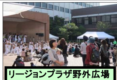
リージョンプラザ野外広場