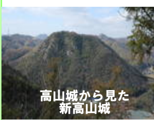
高山城から見た新高山城