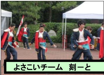
よさこいチーム 刻一と