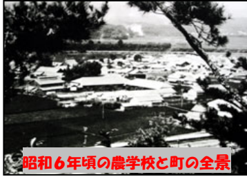
昭和6年頃の農学校と町の全景

本郷の地名は地域の中心を示し、全国に多くあります。特に東京大学のある本郷は多くの人に知られています。三原市の本郷は、沼田荘の内部の郷で沼田本郷または本郷と呼ばれるようになった。歴史的にも政治的・経済的・交通上の要衝地として往時から人々が集まって街が作られてきました。