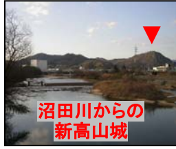
沼田川からの新高山城