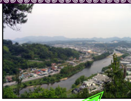
新高山城からの沼田川

「沼田川でカンコ子ヨ」(方言、生活語でメダカのこと)がきた。上り下りの船頭が米や石灰つんだゲナ：「これは本郷の民謡「ゲナゲナ節」の一節です。今の風景からはまったく想像もつきませんが、歴史的に沼田川は、交通と物流の重要な役割を果たしていたことから歌が生まれてきたと考えられます。江戸時代後期から昭和初期にかけて、本郷町船木あたりまで舟運があったといわれています。