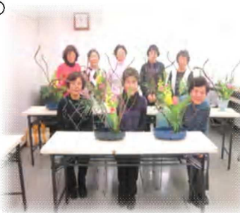
生花教室の皆さん