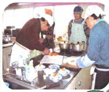
男性料理教室の皆さん