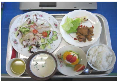
12月14日(水)の教室、美味しく出来上がりました。