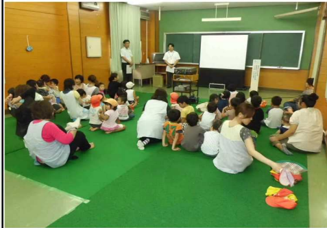
アニメまつりの風景

8月17日(金)に人権文化センターで 開催し、48名の参加者がありました。 「一つの花」「ねずみくんのきもち」など 3本をみんなで鑑賞しました。 夏休みのよい思い出になったのでは ないかと思います。