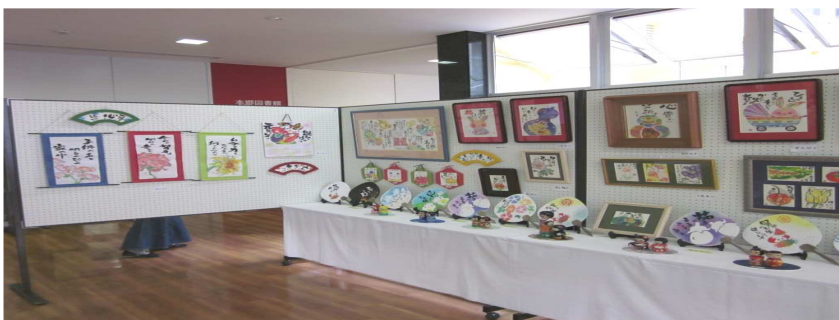
昨年度の絵手紙展示の様子

○本郷人権文化センターは、絵手紙教室の皆さんの作品と「女性の人権」と題したパネルを展示します。皆様のご来場、お待ちしております。